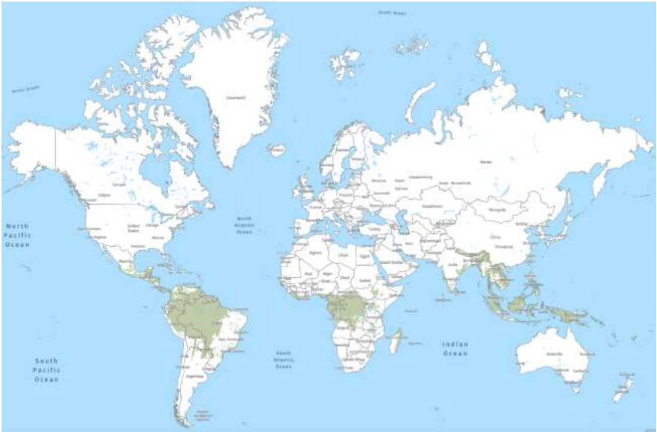
Imagen 1. Localización de los bosques tropicales 1